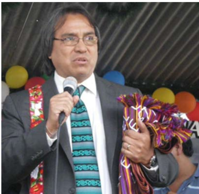
James Anaya en San Juan. Sacatepequez, 15/06/10.

Medidas Cautelares, particularmente la suspensión de las operaciones de la mina Marlin. También están violando el derecho internacional ambiental por no aplicar el principio