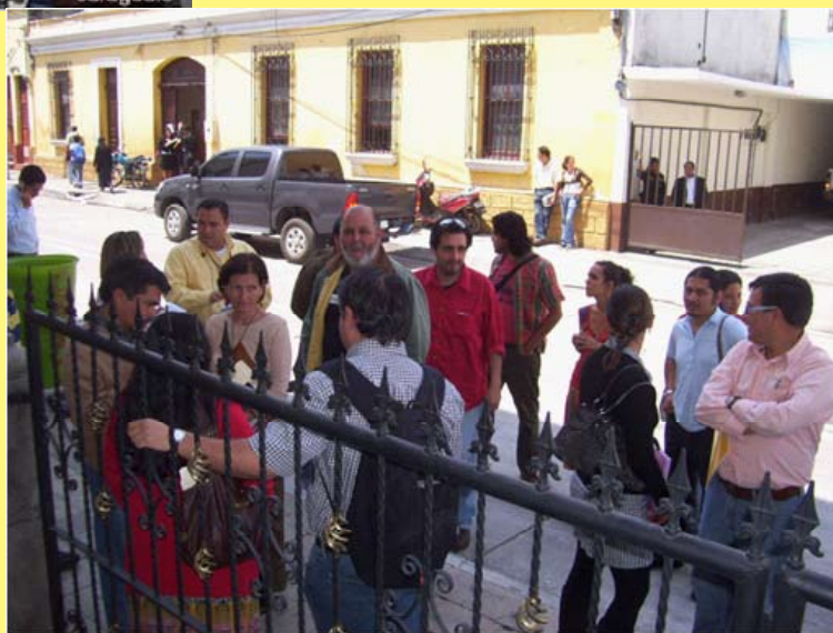
Profesionales entregando una carta a la Presidencia de la República en contra del Reglamento de Consultas propuesto por el gobierno.

El jueves 24 de marzo, 563 personas profesionales originarias de Guatemala y otros países, dedicadas a la investigación social, la academia, el arte, las luchas feministas, la defensa de los derechos humanos, comprometidas con las luchas de los pueblos indígenas y con el futuro de los Pueblos, entregaron una carta abierta al Presidente de la República exigiendo que suspenda sus intentos por aprobar el “Reglamento para el Proceso de Consulta del Convenio 169 de la OIT” que viene promoviendo en los últimos días, y que cumpla con las Medidas Cautelares otorgadas por la CIDH en contra de la mina Marlin.