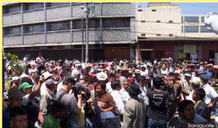
Movilización frente a la CC para presentar la Acción de Amparo en contra del Reglamento.

El 23 de marzo del año en curso, las organizaciones sociales representadas en el Consejo de los Pueblos de Occidente (San Marcos, Huehuetenango, Quiché, Totonicapán, Sololá, Quetzaltenango y Retalhuleu), presentaron una Acción de Amparo a la Corte de Constitucionalidad en contra del proyecto